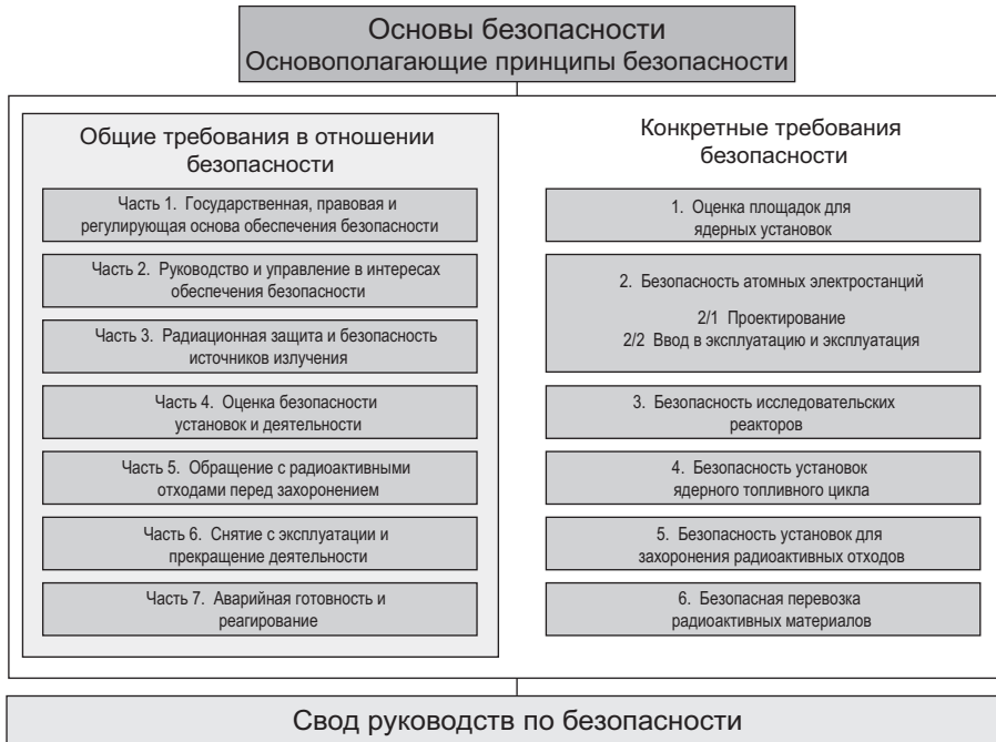
РИС. 1. Долгосрочная структура Серии норм МАГАТЭ по безопасности.