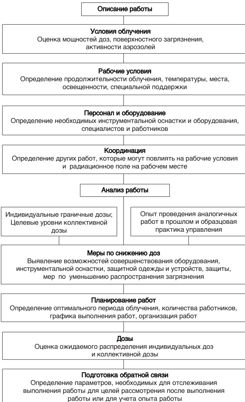
РИС. 2. Анализ работ