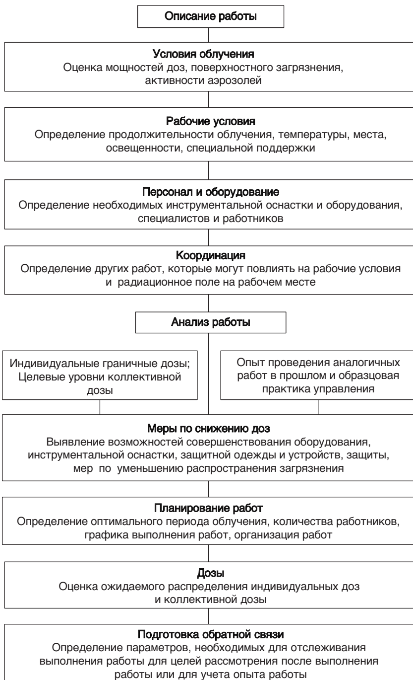
РИС. 2. Анализ работ