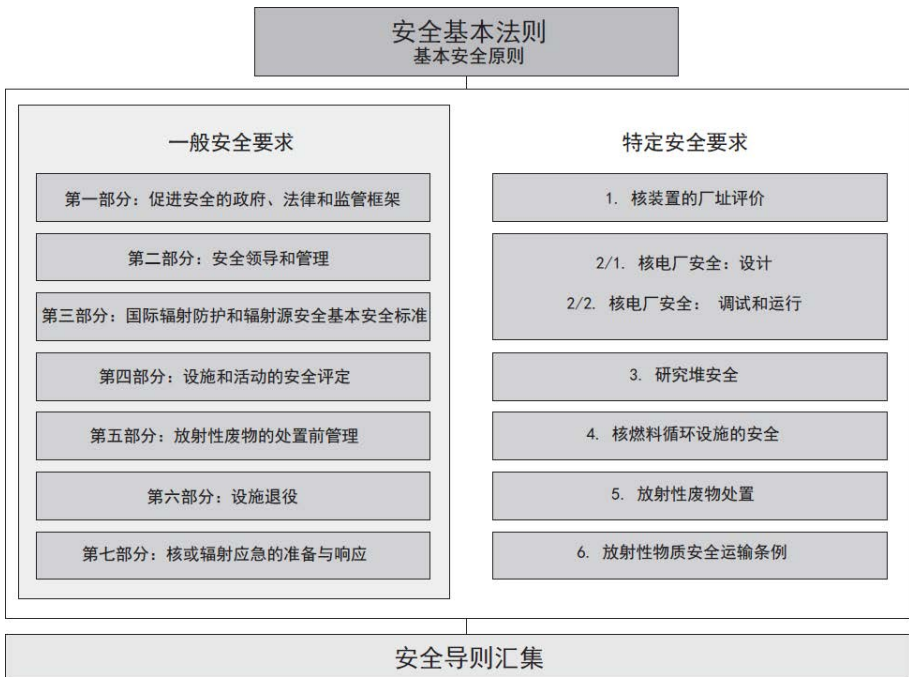
图1. 国际原子能机构《安全标准丛书》的长期结构。

原子能机构安全标准反映了有关保护人类和环境免受电离辐射有害影响的高水平安全在构成要素方面的国际共识。这些安全标准以原子能机构《安全标准丛书》的形式印发，该丛书分以下三类（见图1）。