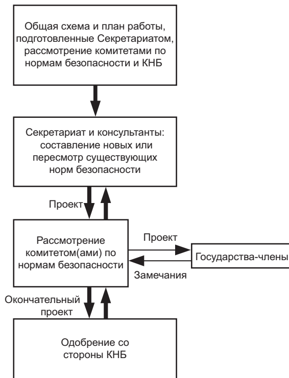
РИС. 2. Процесс разработки новых норм безопасности или пересмотр существующих норм.