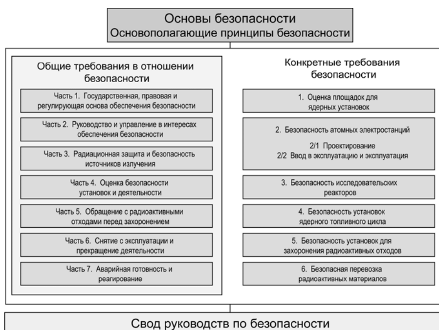
РИС. 1. Долгосрочная структура Серии норм МАГАТЭ по безопасности.

Нормы МАГАТЭ по безопасности отражают международный консенсус в отношении того, что составляет высокий уровень безопасности для защиты людей и охраны окружающей среды от вредного воздействия ионизирующего излучения. Они выпускаются в Серии норм МАГАТЭ по безопасности, которая состоит из документов трех категорий (см. рис. 1).