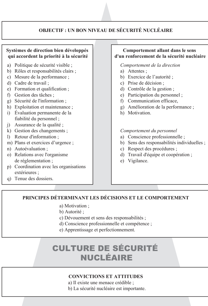
FIG. 2. Caractéristiques d'une culture de sécurité nucléaire.